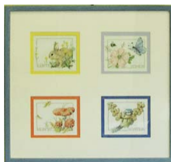
meergaten- dubbel passe-partout