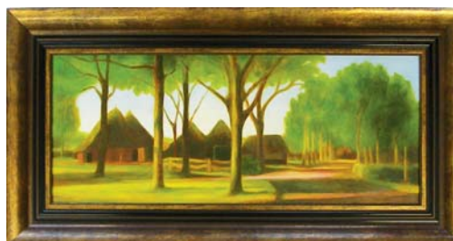
ingelijst paneel (Schilderij van Frea Stuurwold)