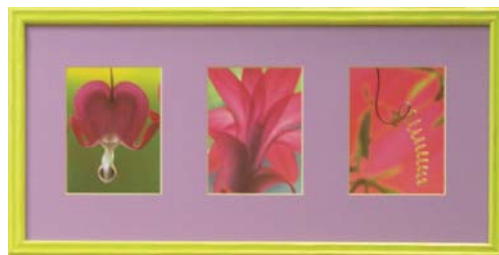
foto's ingelijst in een meergaten passe-partout

Wij zeggen dan ook: " Alles is in te lijsten "