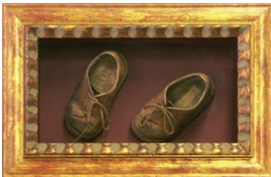
schoentjes in een driedimensionale lijst

Onze Lijstenmakerij is gespecialiseerd in het inlijsten van borduurwerken, meergaten passe-partouts, aquarellen en olieverfdoeken. Denk ook eens aan het inlijsten van geboortekaartjes en de doopjurk of eerste schoentjes van uw kind of kleinkind.