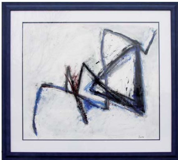
acryl schilderij (galerie Mariushuys)

Ingelijst werk voorpagina: "de Toyisten" www.toyisten.nl